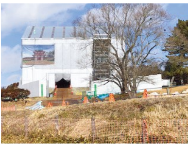
▲多賀城南門復元工事現場

現在、建設現場には工事用の覆屋が建てられており、その中で建物建築工事が進められています。