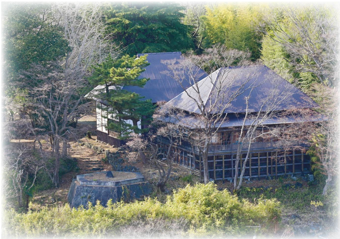
〔二市三町フォトライン〕 時をかけて（塩竈市）