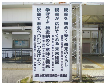
「標語」本塩釜駅アクアロ