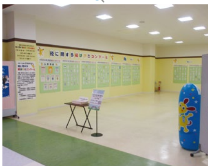
「絵はがき」イオンタウン塩釜2階