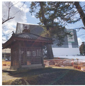
多賀城南門復元工事現場(北側から)▶ 手前が多賀城碑の覆堂です。