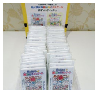
「絵はがきポケットティッシュ」 マリゲート塩釜確申会場入口