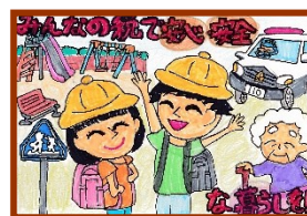
塩釜法人会会長賞